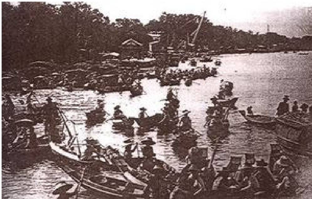
การค้าขายของชาวจีน