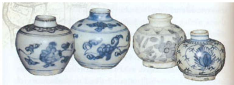
กระปุกลายคราม เขียนลายช่อดอกไม้ ศิลปะจีนราชวงศ์หมิง ราวพุทธศตวรรษที่ 21-22

เชื่อกันว่ามีประชากรจีนในสยามตอนปลายรัตนโกสินทร์ จำนวนประมาณ 1 หมื่นคน ซึ่งส่วนใหญ่เป็นชาย