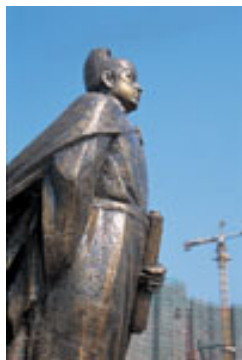
เจิ้งเหอ

คนจีนเรียกพระพนัญเชิงว่ “ชำเปากง” ซึ่งหมายถึง ชั้นที่นามว่ “เจิ้งเหอ” ท่านเป็นแม่ทัพเรือ ผู้เกรียงไกรในสมัยราชวงศ์หมิง เมื่อสิ้นชีวิตลงได้รับการยกย่องให้เป็นเทพตามธรรมเนียมจีนและเล่าเป็น ตำนานจีน เชื่อกันว่ “เจิ้งเหอ” เคยเดินทางมายังกรุงศรีรัตนโกสินทร์และอาจเคยมีส่วนร่วมในการ ปฏิสังขรณ์พระพนัญเชิง ซึ่งเป็นพระพุทธรูปที่ตั้งอยู่ในย่านที่พักอาศัยของชาวจีน ทำให้ได้ชื่อว่พระชำ เปากง ดังนั้นเมื่อไหว้พระพนัญเชิง จึงเสมือนเคารพ “เจิ้งเหอ” ไปพร้อมกันด้วย ดังที่เอกสาร โบราณของ จีนระบุไว้ว่ วัดพนัญเชิงเป็นที่กราบไหว้ระลึกถึง “เจิ้งเหอ” ทุกวันนี้ในเทศกาลตรุษจีน ชาวจีนยังนิยม เดินทางมากราบไหว้ชำเปากงอยู่เสมอ