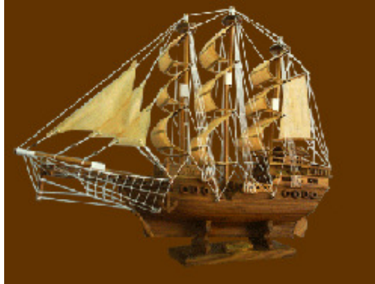
เรือสำเภาจีน

ในช่วงที่ฝรั่งเศสเริ่มเข้ามาค้าขายในดินแดนรัตนโกสินทร์ ฝรั่งเศสก็พบว่า เมืองทุกเมืองที่ตนไปก็มีชาวจีนทำการค้าอยู่แล้วจำนวนมาก เช่น เมืองปากน้ำโพ (นครสวรรค์) บางปลาสร้อย (ชลบุรี) แปะดรีว (ฉะเชิงเทรา) ทำจัน (สมุทรสาคร) บ้านดอน (สุราษฎร์ธานี) นครศรีธรรมราช สงขลา ปัตตานี ภูเก็ต เป็นต้น