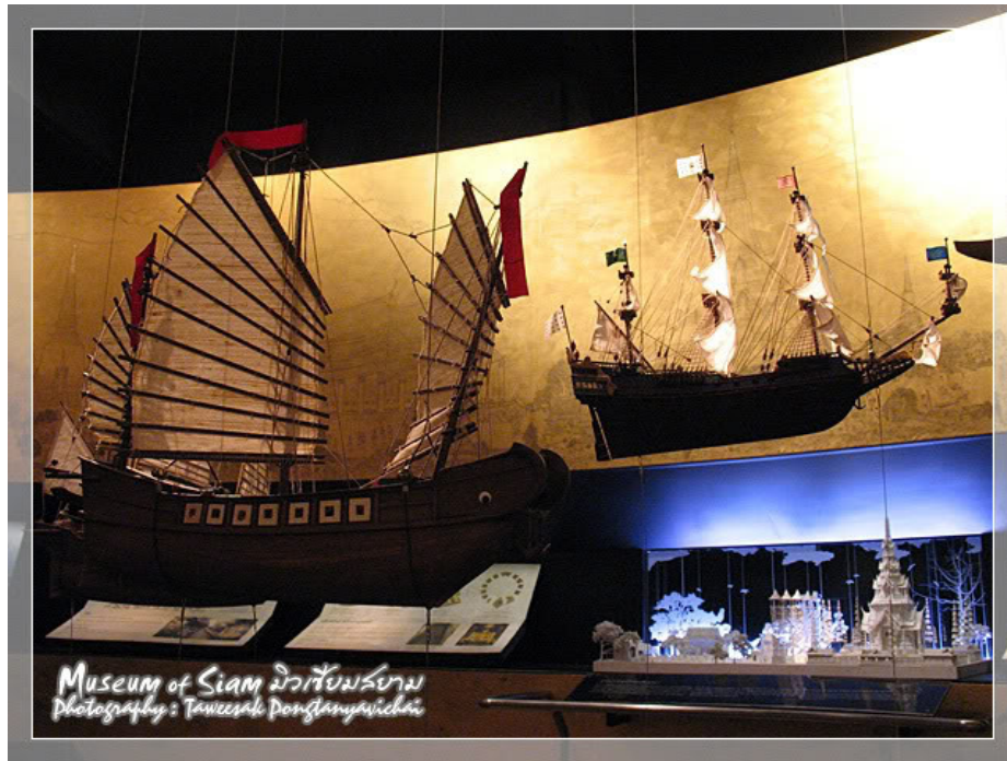
รูปแบบต่างๆของเรือสำเภาจีน