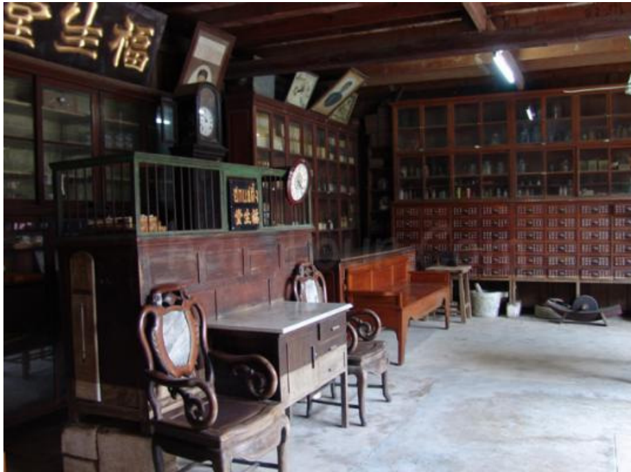
บ้านชาวจีนในสมัยรัตนโกสินทร์