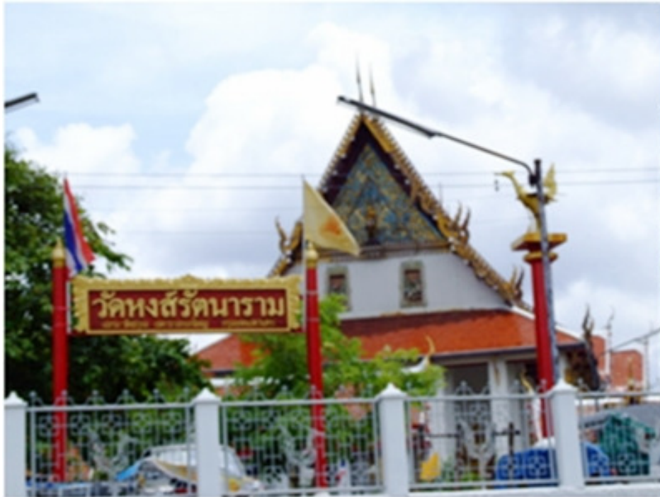
ชื่อเดิมว่า เจ็ท้วง เศรษฐีชาวจีนเป็นคนสร้างขึ้นในสมัยรัตนโกสินทร์