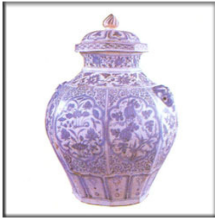
หม้อน้ำพร้อมฝาหรือไหทรงเหลี่ยมลายคราม พบที่กรุวัดมหาธาตุ จ.รัตนโกสินทร์

ในสมัยรัตนโกสินทร์ตอนปลาย ข้าวเป็นสินค้าสำคัญที่ส่งไปเมืองจีน ส่งไปไม่น้อยกว่าปีละ 65,000 หาบ มีบางปีส่งไปขายถึง 1 ล้าน 5 แสนหาบ เนื่องจากปัญหาทุพภิกขภัยในเมืองจีน จักรพรรดิจีนทรงส่งเสริมให้พ่อค้านำข้าวเข้ามาขายให้มากขึ้น โดยสร้างแรงจูงใจด้วยการลดหย่อนภาษี สินค้าอื่นๆ ที่มาพร้อมข้าว และแต่งตั้งให้พ่อค้าที่นำข้าวมาขายได้มีฐานะเป็นขุนนางจีน ส่วนสินค้าที่นำเข้ามาจากจีนนั้น ส่วนใหญ่เป็นสินค้าของคนชั้นสูงและเป็นประเภทฟุ่มเฟือย เช่น ผ้าไหม ผ้าแพร อย่างดี ประเภทต่างๆ ภาชนะเครื่องเคลือบ และทองแดง เป็นต้น ชุมชนจีนในรัตนโกสินทร์ที่สำคัญ อยู่ในพื้นที่ด้านตะวันออกทั้งในและนอกเกาะพระนคร ทั้งสองฝั่งแม่น้ำป่าสัก ซึ่งแม่น้ำช่วงวัดพันธุเชิงจนถึงปากคลองข้าวสารและปากคลองสวนพลูนั้น เป็นที่จอดเรือสำเภา และเรือกำปั่น ดังนั้นเขตย่านนี้จึงเป็นย่านผลิตสินค้าและย่านการค้าของชาวจีน