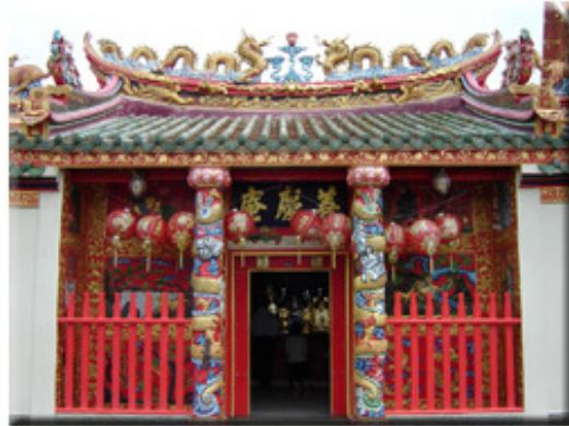
ศาลเจ้าแม่สร้อยดอกหมาก

ชาวจีน เป็นกลุ่มคนที่มีบทบาทสำคัญทางการค้าตลอดสมัยของรัตนโกสินทร์ ทั้งการค้าภายในอาณาจักร และการค้าทางเรือสำเภาระหว่างรัตนโกสินทร์กับจีนและชาติต่างๆ