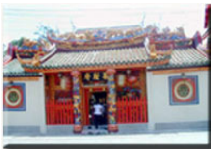
ศาลเจ้าแม่สร้อยดอกหมาก

ด้านข้างวิหารหลวงพ่อดล มีศาลเจ้าจีนเรียกว่า “ตึกเจ้าแม่สร้อยดอกหมาก” การตั้งศาลเจ้าแห่งนี้เกี่ยวข้องกับตำนานเรื่อง “พระนางสร้อยดอกหมาก” ซึ่งเล่าไว้ในพงศาวดารเหนือว่า พระเจ้ากรุงจีนมีบุตรบุญธรรมชื่อ พระนางสร้อยดอกหมาก พระองค์โปรดเกล้าฯ ให้อภิเษกกับพระเจ้าสายน้ำผึ้งผู้ครองกรุงอโยธยา หลังจากพิธีอภิเษก พระเจ้าสายน้ำผึ้งก็เสด็จกลับมาเตรียมต้อนรับพระนางที่พระนครก่อน และไม่ได้มารับพระนางขึ้นจากเรือด้วยพระองค์เอง กลายเป็นเหตุให้พระนางน้อยพระทัย ไม่ยอมขึ้นจากเรือ ขุนนางต้องกลับไปทูลให้ทรงทราบ พระองค์ทรงเสด็จมาเชิญพระนางด้วยตนเอง และสัพยอกว่าหากไม่ไปก็จะอยู่ที่นี้ต่อไป พระนางจึงเสียพระทัยกลั่นใจจนสิ้นพระชนม์ ณ ที่นั้น พระเจ้าสายน้ำผึ้ง จึงโปรดเกล้าฯ ให้อัญเชิญพระศพขึ้นมาพระราชทานเพลิงบนบก และสถาปนาบริเวณนั้นเป็นวัดพนัญเชิง