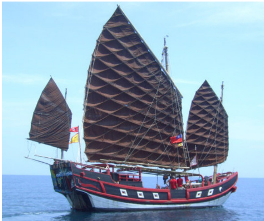
เรือสำเภาจีนที่มีบทบาทในการค้า