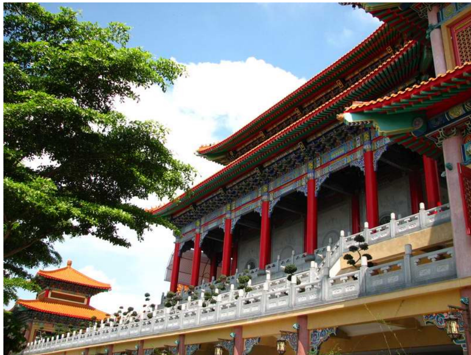
ในการบำเพ็ญกุศลชาวจีนยังคงอาศัยวัดไทยในสมัยรัตนโกสินทร์