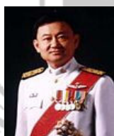
พ.ต.ท. ทักษิณ ชินวัตร