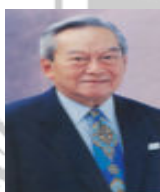
พลเอกชาติชาย ชุณหะวัณ