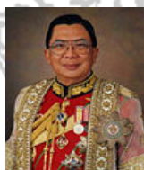
พลเอก ชวลิต ยงใจยุทธ