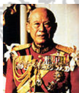
จอมพล ถนอม กิตติขจร