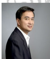
นายอภิสิทธิ์ เวชชาชีวะ