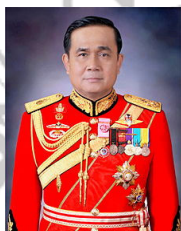
พลเอกประยุทธ์ จันทร์โอชา