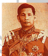
จอมพลสฤษดิ์ ธนะรัชต์