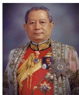
พลเอกสุรยุทธ์ จุลานนท์