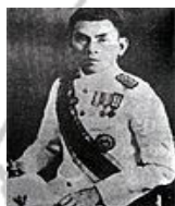
พลเรือตรีถวัลย์ ชำรงนาวาสวัสดิ์