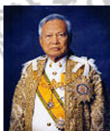
พลเอกเปรม ติณสูลานนท์