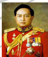
พลเอกสุจินดา คราประยูร